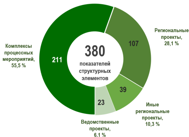
Рис. 6 – Показатели государственных программ в разрезе структурных элементов

В структурные элементы государственных программ включено 380 показателей, количественно и качественно характеризующих ход их реализации. По итогам 2025 года достигнуто 333 показателя структурных элементов государственных программ (или 87,6 % от общего количества). Средний уровень достижения показателей структурных элементов государственных программ составил 120,2 %.