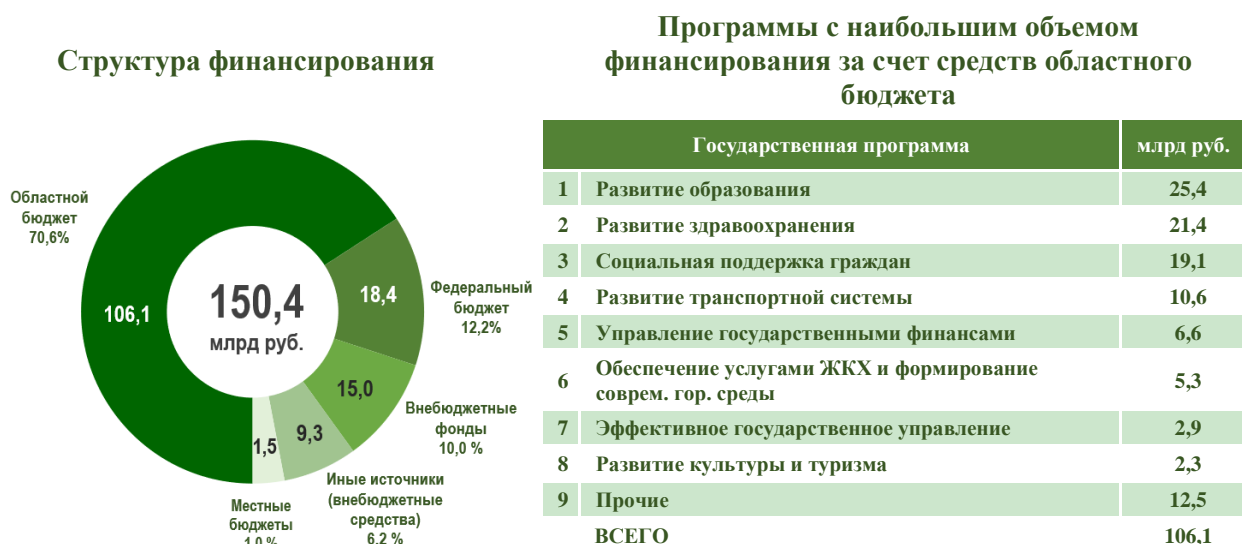
Рис. 2 – Ресурсное обеспечение государственных программ Липецкой области

Из них основная доля 70,6 % – средства областного бюджета (106 120,9 млн руб.); 12,2 % – средства федерального бюджета (18 364,8 млн руб.); 10 % – средства внебюджетных фондов и государственных корпораций (15 034,2 млн руб.); 6,2 % – средства внебюджетных источников (9 349,1 млн руб.); 1 % – средства местных бюджетов (1 492 млн руб.).