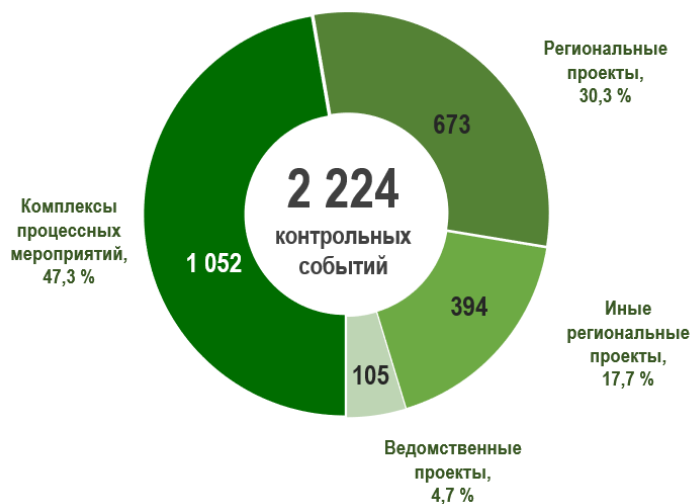
Рис. 8 – Контрольные (события) точки в разрезе структурных элементов государственных программ

В утвержденные планы реализации государственных программ включено 2224 контрольных события (точки). Из них, согласно информации, представленной в годовых отчетах, в 2025 году достигнуто 2 170 контрольных событий (точек) или 97,6 % от общего числа.