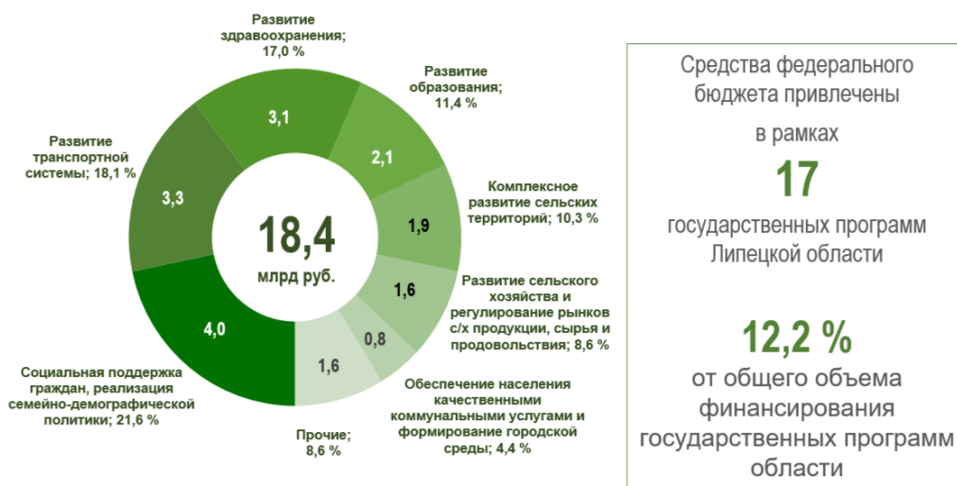
Рис. 3 – Привлечение средств федерального бюджета в рамках реализации государственных программ Липецкой области в 2025 году

В 2025 году расходы за счет средств федерального бюджета планировались в рамках 17 государственных программ. Всего из федерального бюджета на реализацию мероприятий государственных программ было направлено 18 364,8 млн руб., или 99,6 % от годового плана (86 % к уровню 2024 года) (рис. 3).