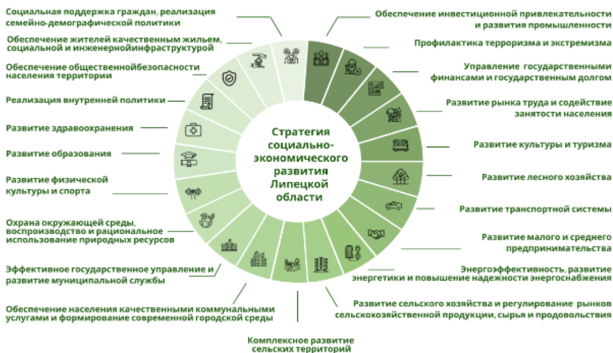
Рис. 1. – Государственные программы Липецкой области

Государственные программы разработаны в соответствии с Перечнем государственных программ Липецкой области, утвержденным постановлением Правительства Липецкой области от 15 мая 2023 года № 245 «Об утверждении Перечня государственных программ Липецкой области», которым определены исполнительные органы Липецкой области, ответственные за разработку и реализацию соответствующих государственных программ и основные направления их реализации, соответствующие стратегическим целям.