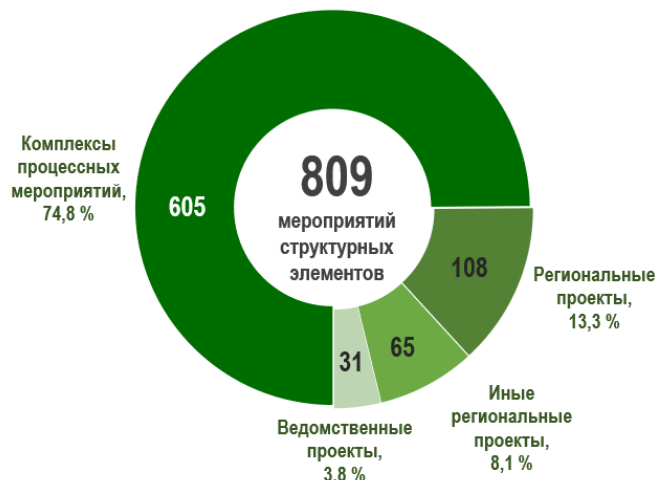
Рис. 7 – Мероприятия (результаты) государственных программ в разрезе структурных элементов