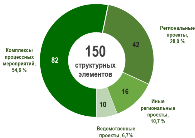
Рис. 5 – Структурные элементы государственных программ Липецкой области

Всего государственные программы включают 150 структурных элементов, из них 68 составляют проектную часть (региональные проекты (РП), иные региональные проекты (ИРП) и ведомственные проекты (ВП) и 82 – процессную часть (комплексы процессных мероприятий (КПМ)).