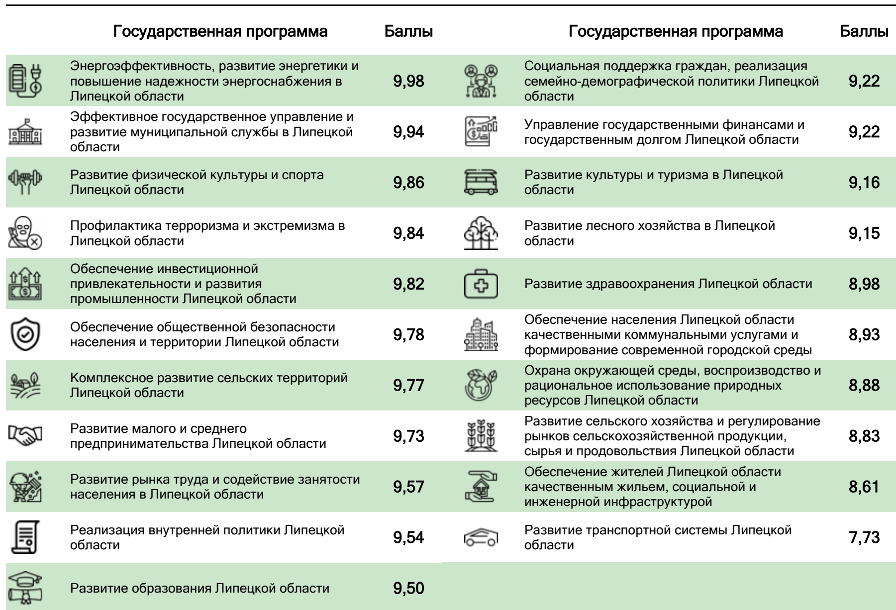
Рис.9. – Оценка эффективности государственных программ Липецкой области за 2025 год