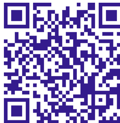
Тепловая карта регионов